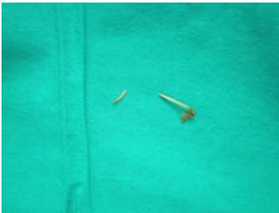
Figura 4 - Espinhas de peixe

Abcesso Retroperitoneal (pararenal) pós-perfuração do tracto digestivo (provavelmente o cólon direito) por objecto estranho - espinha de peixe, cuja deglutição passou despercebida pelo doente. Confusão diagnóstica inicial atendendo a que o corpo estranho foi descrito como tendo densidade metálica, e o doente (carpinteiro) não apresentava antecedentes cirúrgicos.