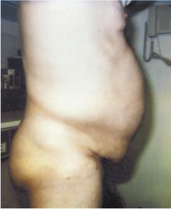
Fig. 1 – Abdomen volumoso. Caso clínico 1.

tes inferiores do abdômen, aparentemente em continuidade com a bexiga.”