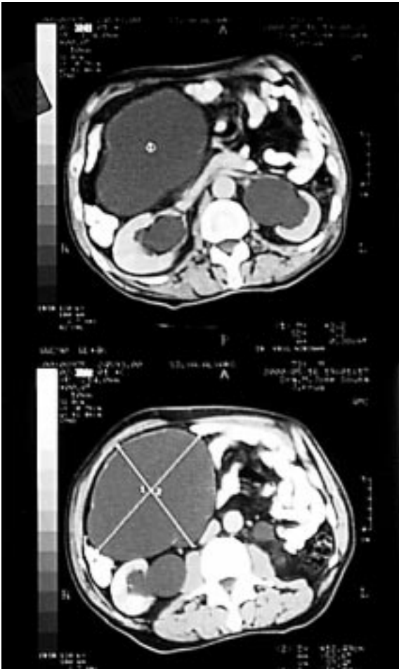
Fig. 2 e 3 – TAC. Caso clínico 1.

No seguimento deste doente, verificou-se uma melhoria ligeira da função renal, tendo a mesma