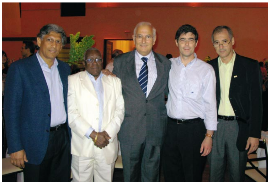
Fig. 9 - 1º Simpósio Lusófono de Urologia, Salvador Bahia, 2007