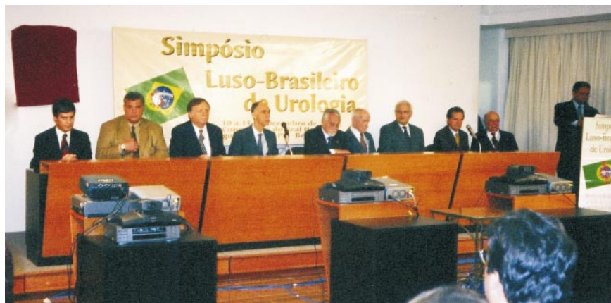
Fig. 7 - Mesa abertura Simpósio Luso-Brasileiro, do Achamento, Recife, 2000