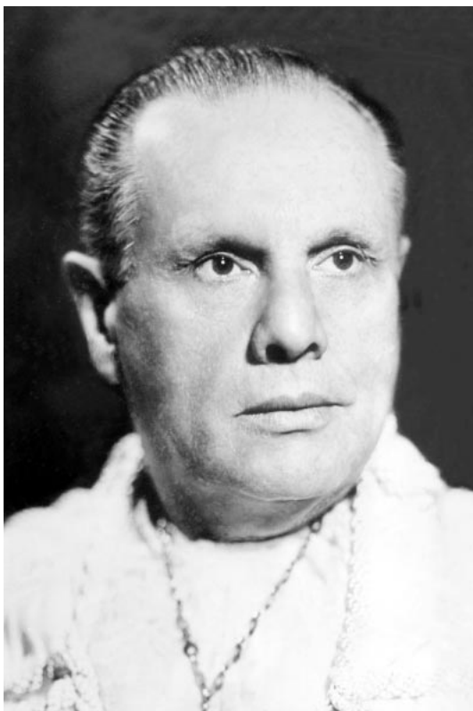
Fig. 3 - Álvaro Cumplido Santana (Presidente da SBU e 1º Presidente da CAU)