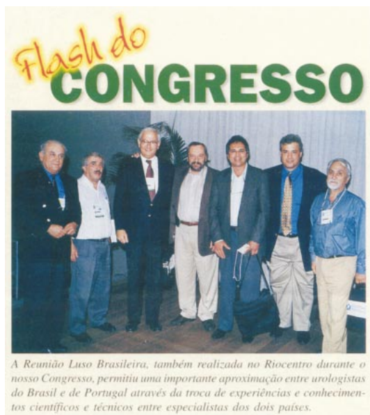
Fig. 6 - 1º Simpósio SBU-APU, Rio de Janeiro, 1999